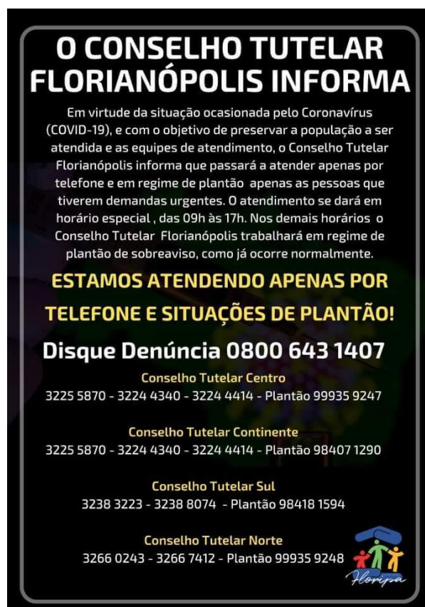
INFORMATIVO CONSELHO TUTELAR